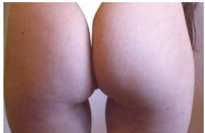
Ergebnis nach 6 Behandlungen in einem Zeitraum von vier Monaten.