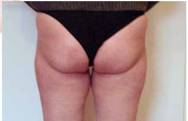
Ergebnis nach 5 Behandlungen in einem Zeitraum von drei Monaten.