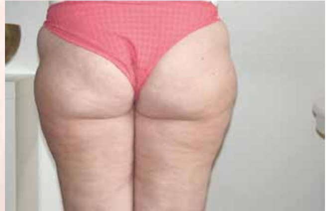
Ergebnis nach 6 Behandlungen in einem Zeitraum von vier Monaten.